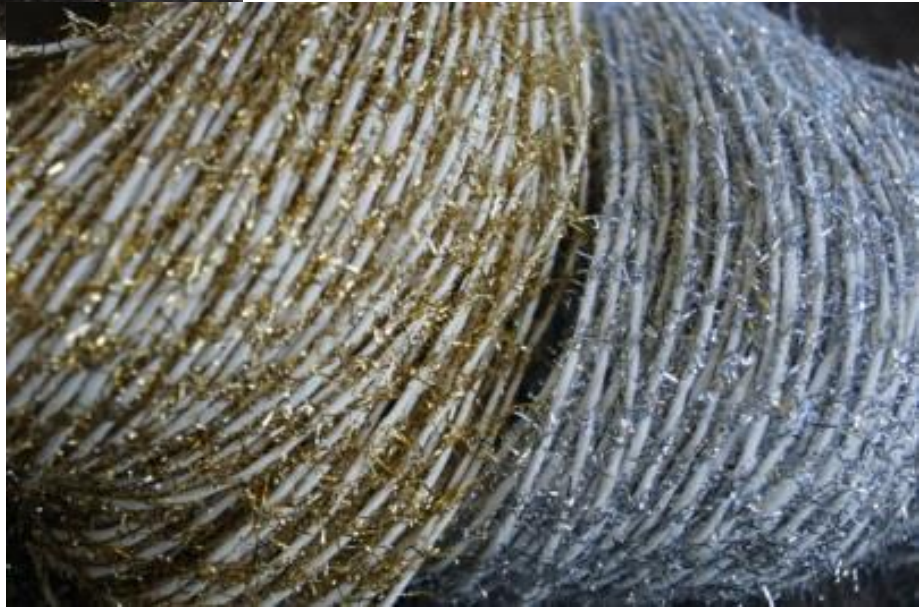
Papiergarn 1.65 mit Silberfäden in: rot/gelb/hellblau/ helloliv/ zement/pink Mit Goldfäden in: d.grün/schwarz/rot/