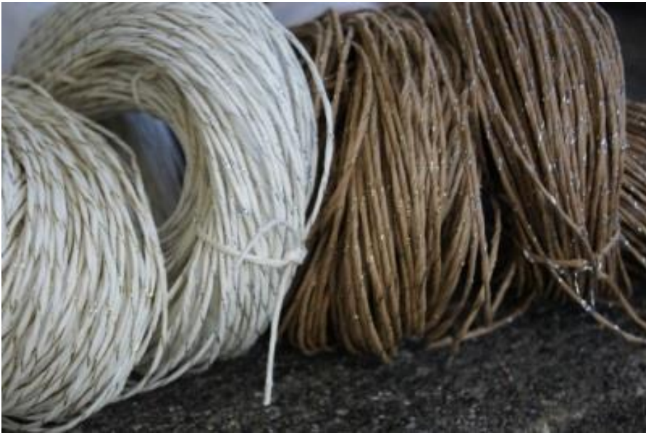
Papiergarn 0.8 in Roh und weiss mit Gold und Silber Lurexfäden