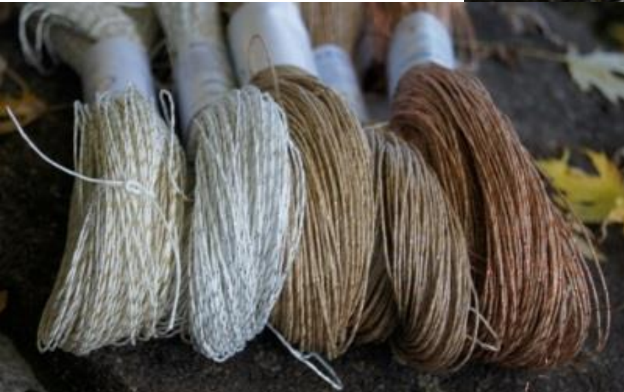
Papiergarn 1.65 in Roh und weiss mit Gold und Silber Lurexfäden und Fransenlurex